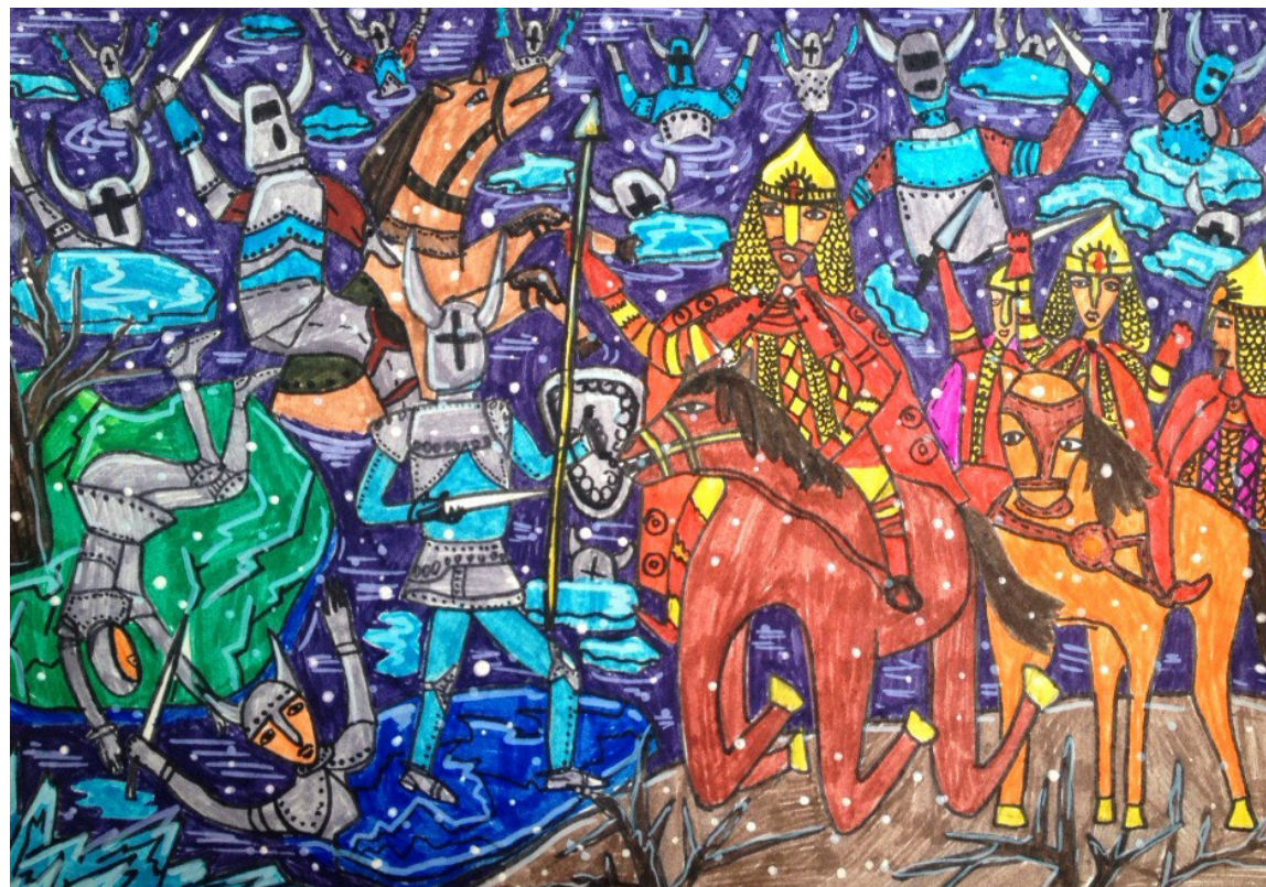
«Ледовое побоище на Чудском озере»