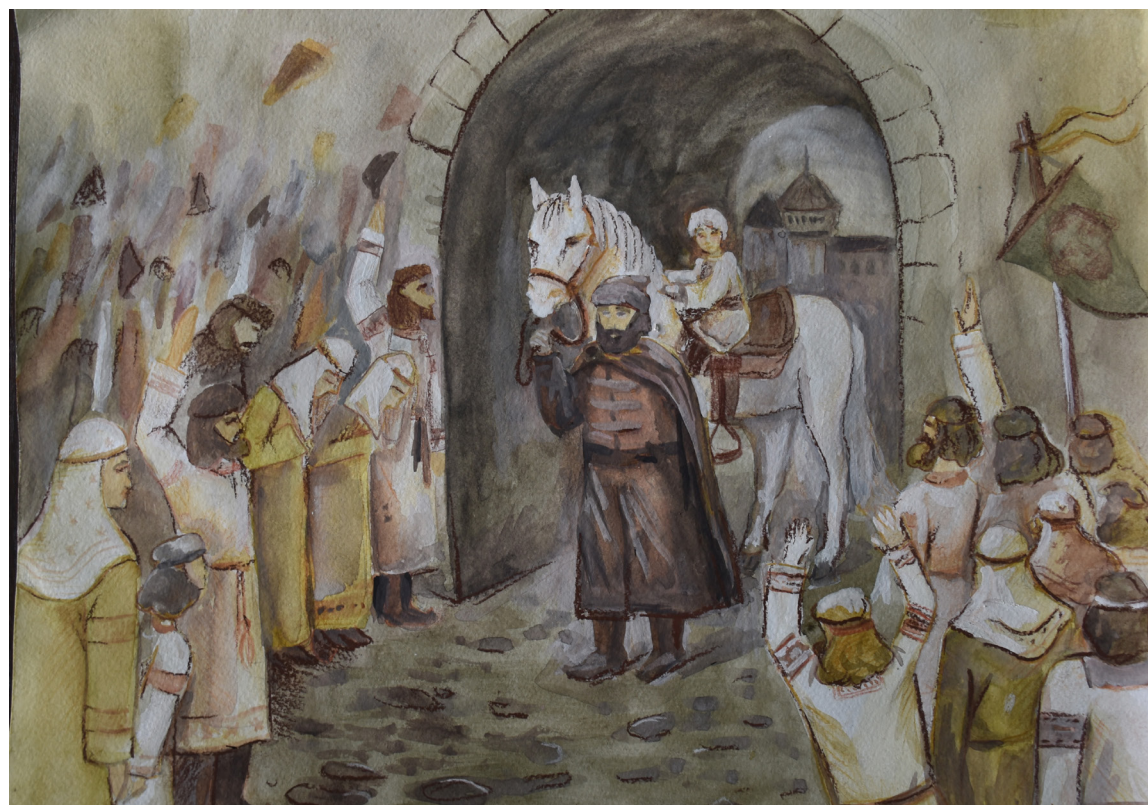
«Представление юного княжича Александра народу»